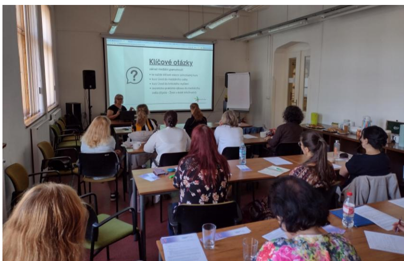
Obr.: Jedna z prezenčních vzdělávacích aktivit pro knihovníky.